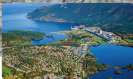
Ordfører Synnøve Solbakken kan tilby næringsareal mange stader i kommunen.

Kommunen har i denne faldaren sett opp ei oversikt over næringsareal der arealbruken er avklara i kommuneplanen. Det er vidare teke med ein del opplysningar om status, dvs. grad av tilrettelegging, eigartilhøve, areal osv.