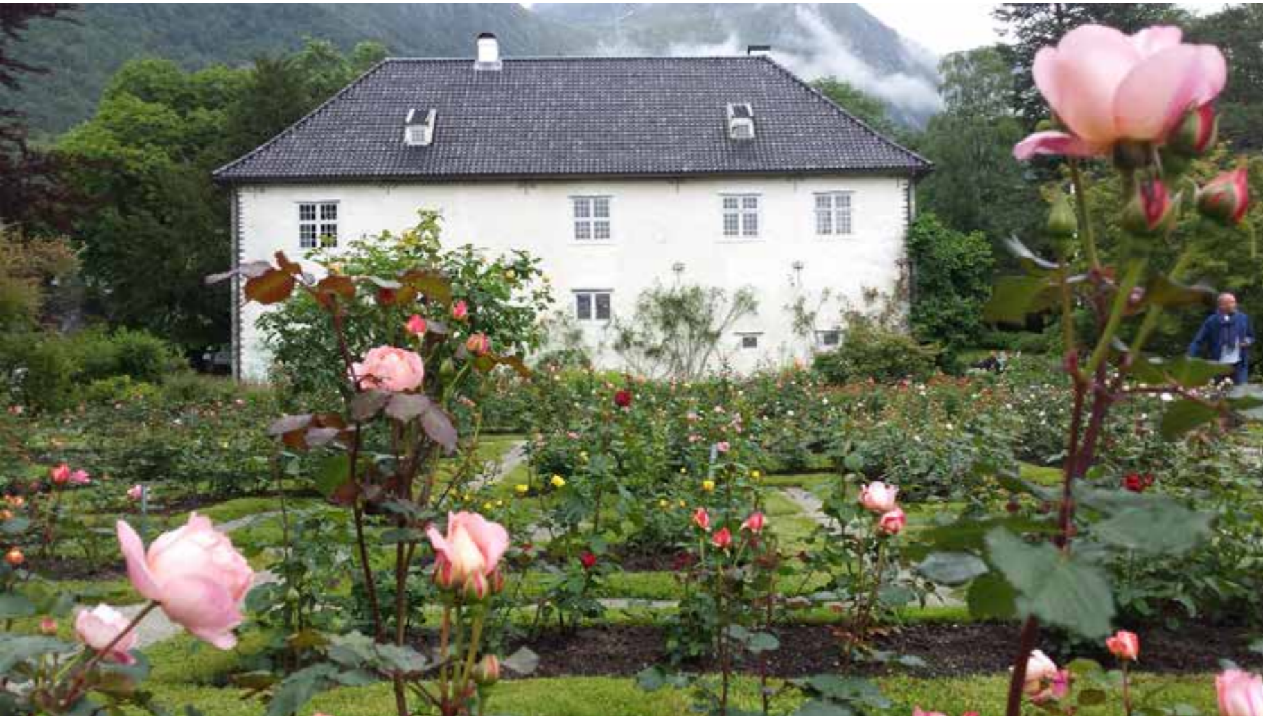
Baroniet i Rosendal

Det er mange kulturminne i Kvinnherad som vi skal ta vare på og verna. Det er kulturmiljø, kulturlandskap og landskapsvernområde som er viktige for kulturen vår, ikkje berre lokalt, men og regionalt og nasjonalt. Innsamla innspel og kunnskap, bilete og filmar er grunnlaget for det vidare arbeidet med kulturminna i Kvinnherad og skal bli ein base for kunnskap, og for vidare arbeid med kulturminne.