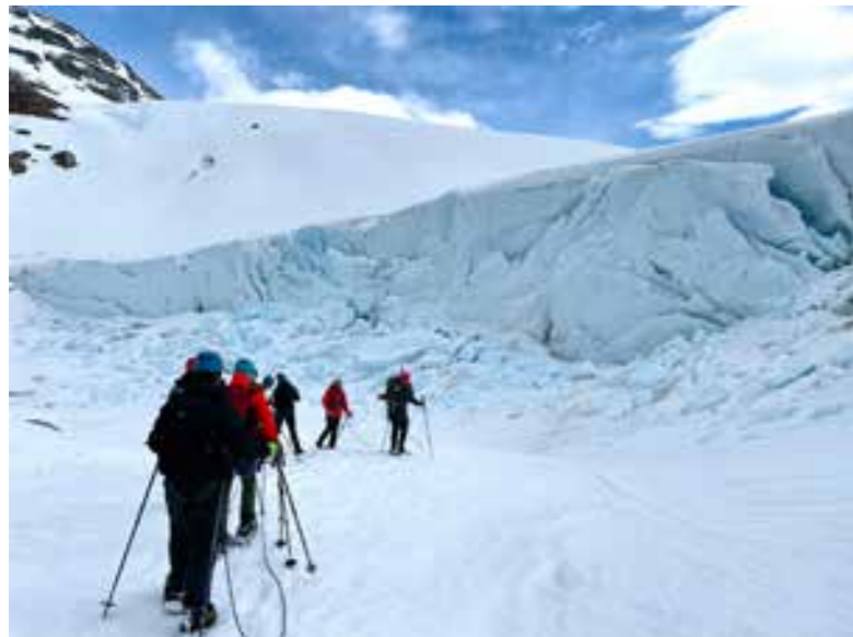
Brevandring anno 2021