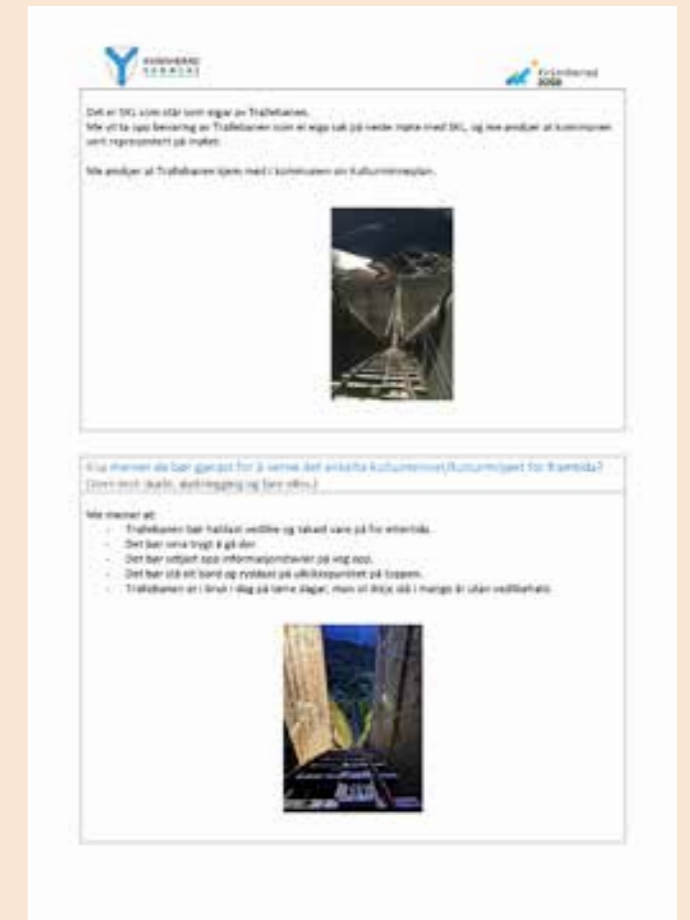
Gjestebod som innspel til planen. Kvinnherad kommune.