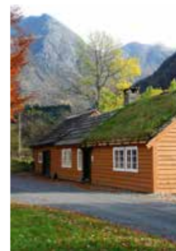
Malmanger Prestegard