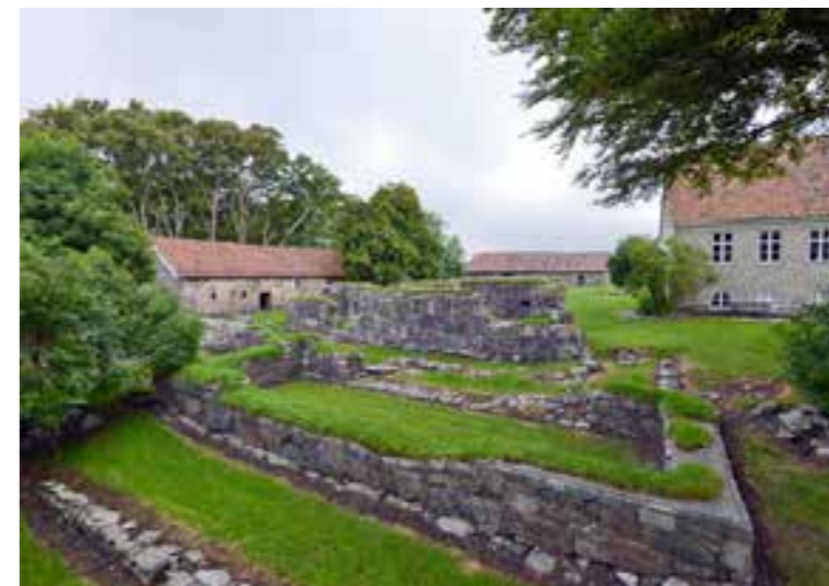
Huset og tunet på Halsnøy kloster