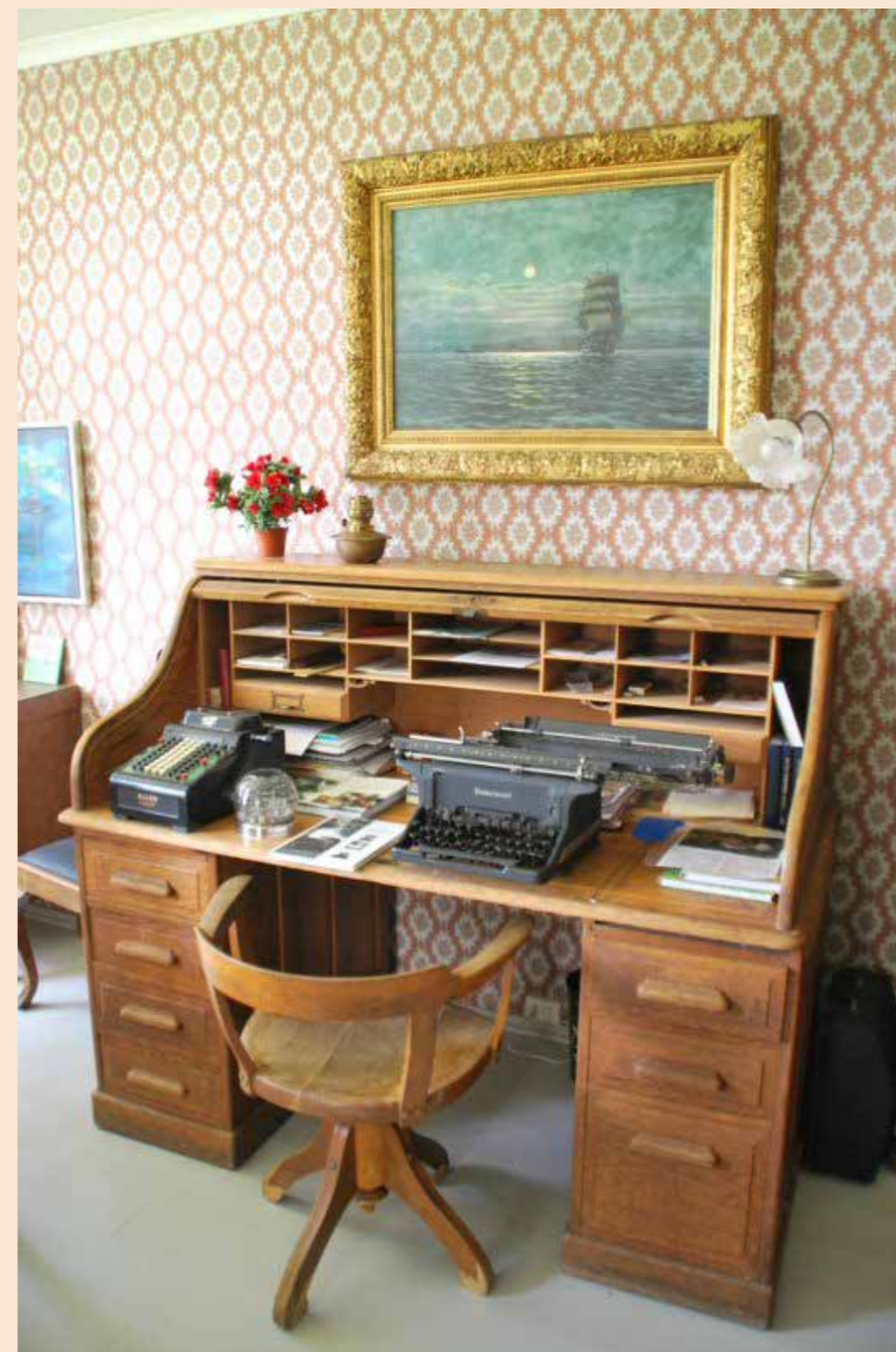
Kontorpult frå Fjelberg prestegard