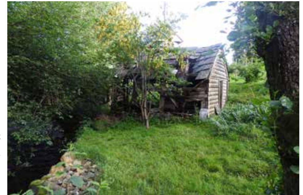
Ståande bygning

Tema for ulike kulturmiljø og kulturminne vil vera den fyrste delen av dette kapitlet. Utgreiingar om dei einskilde prosjekta vert ført vidare til handlingsdelen og planen for dei neste fire åra. Dette med utgangspunkt i planprogrammet og kulturmyndighetene sine føringar. Det vert her laga ei prioritering av kulturminne og kulturmiljø som skal takast med for denne planperioden. Verdier i høve til kunnskap, opplevingar og bruk, og vidare vektning av desse verd-