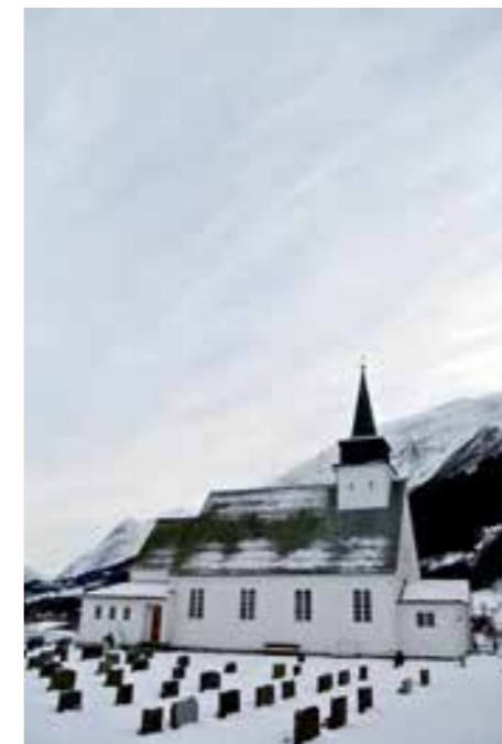
Uskedal kyrkje desember 2012