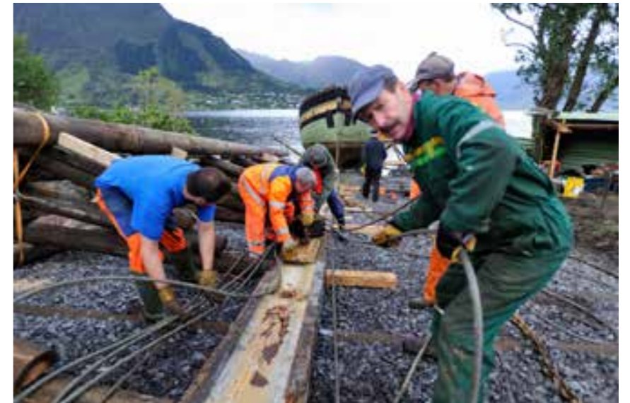
24. september 2011. Landsetting med to gravemaskiner, gio, mykje dugnadsfolk og tusen gode råd.

Med bakgrunn i folkehelse og FN sine berekraftsmål vil kulturminnearbeidet vårt vera med å leggja til rette for grøne, friske og attraktive bygder i Kvinnherad. Kvinnherad kommune skal ta vare på kulturarven i samsvar med utviklinga i åra som kjem.