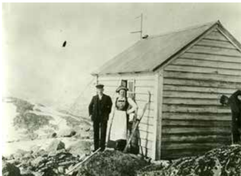
På Fonna

isert og saman med landsette marinesoldatar kjempa dei mot tyske troppar, men laut trekkja seg attende. På Valen sjukehus bygde dei eit naudlasarett. På trass av skyting med handvåpen og mitraljøser vart det ikkje større tragediar.