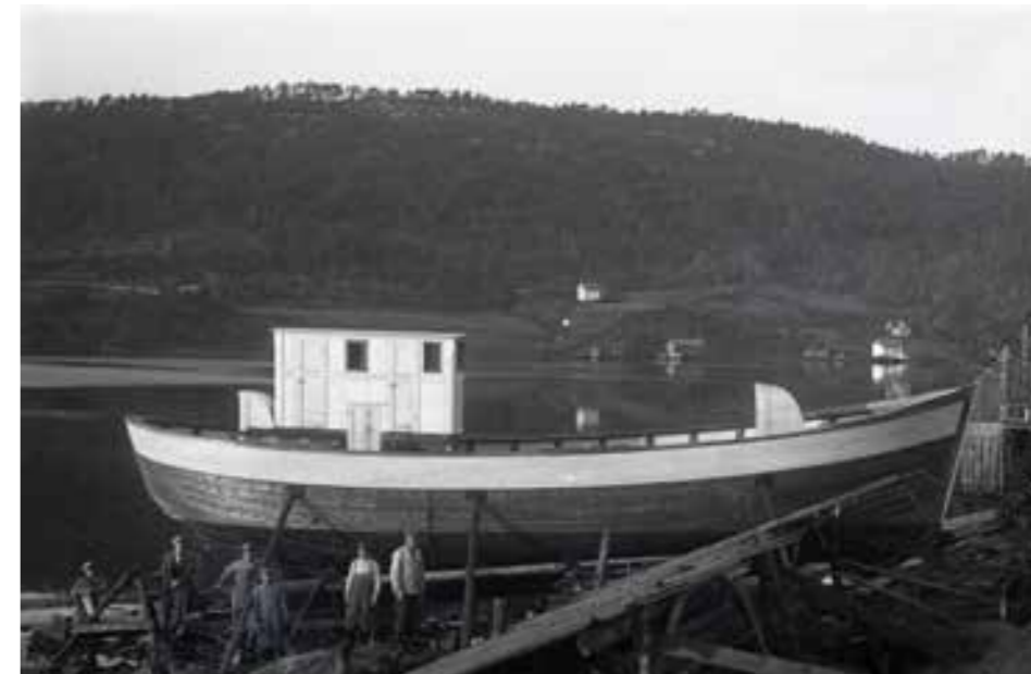
Kryssar bygd ny i Ølve i 1945

Båtbyggjarverkstaden på Ramsgrø gard er i privat eige og blir no restaurert. Dei har fått tildelt støtte frå Kulturminnefondet til dette arbeidet.