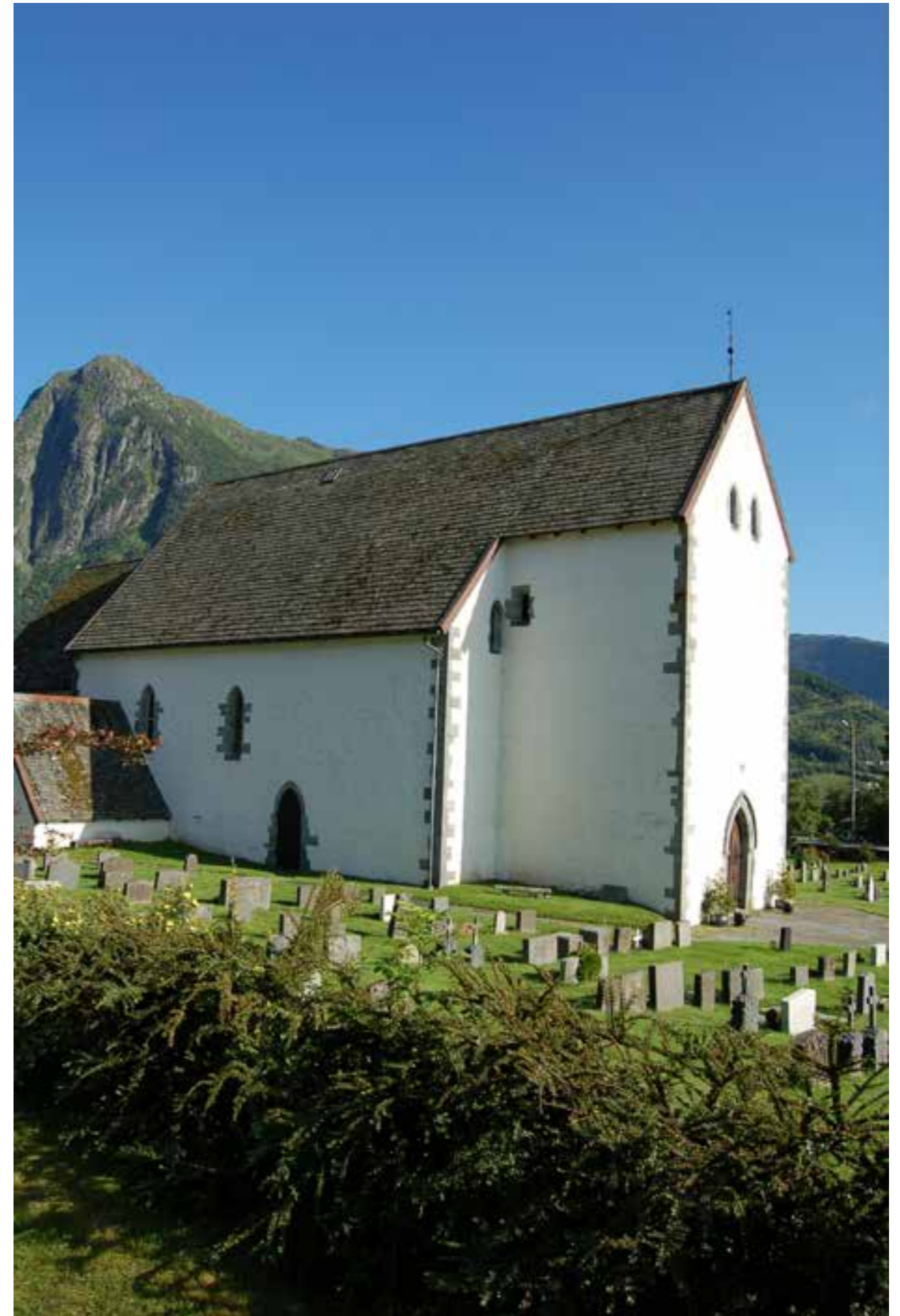
Kvinnherad kyrkje

Denne plikta oppstår når ein avdekkjer automatisk freda kulturminne som ein på førehand ikkje veit om, eller ikkje har grunn til å tru finst. Melding om funn skal innrapporterast til kulturminneforvaltinga i fylkeskommunen med ein gong. Dei avgjer så snart som mogleg – og seinast innan tre veker – om arbeidet kan halda fram, og vilkår for dette. Dersom det føreligg særlege grunnar kan fristen forlengast.