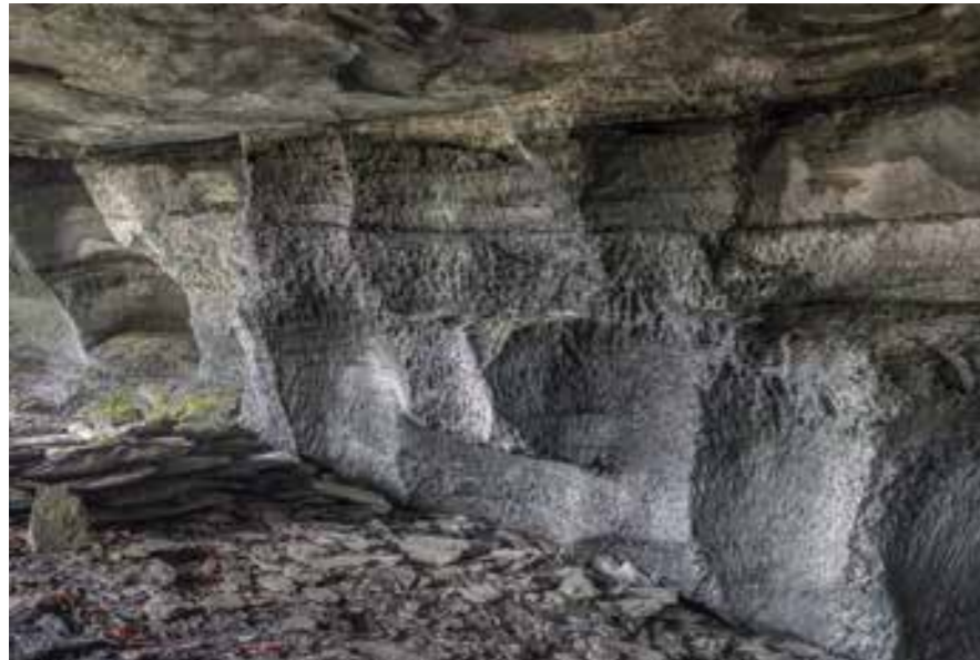
Bakstehellebrot i Fuglebergåsen

Ikkje berre utslåttane og beitemarkene har høyrte til fellesressursane på Gjuvslandsgarden, men òg sagbruket. Fire bruk er partseigarar i den vassdrivne saga. Sagrettane høyrer med til utskiftingsgrunnlaget for bruka, delt med ein fjerdepart på kvar: dei tre første dagane i veka i annankvar månad på eitt bruk, dei tre siste dagane i veka på det neste. Saga vart driven av eit stort underfallshjul som fekk vatn frå ei lita demning i elva ovanfor. I dag står det ei sirkelsag