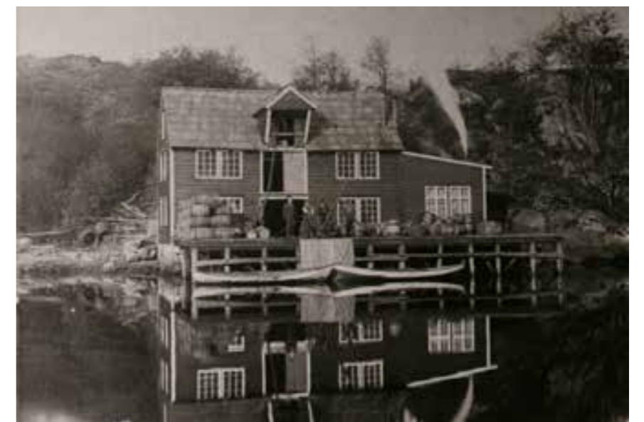
Bergslagen i gamledagar

medan yngre enn dette vert rekna som «kulturminne i nyare tid». Planen skal i første rekkje omfatta faste kulturminne og kulturmiljø. Det er også viktig at vi gjennom planarbeidet identifiserer sentrale område innanfor det immaterielle kulturminnevernet som det er naudsynt å fokusera på i framtida. Kommunedelplan for kulturminne omfattar heile kommunen. For å sikra kulturminne og kulturmiljø etter plan- og bygningslova, må desse følgjast opp i reguleringsplanar, og takast med i kommuneplanen sin arealdel.