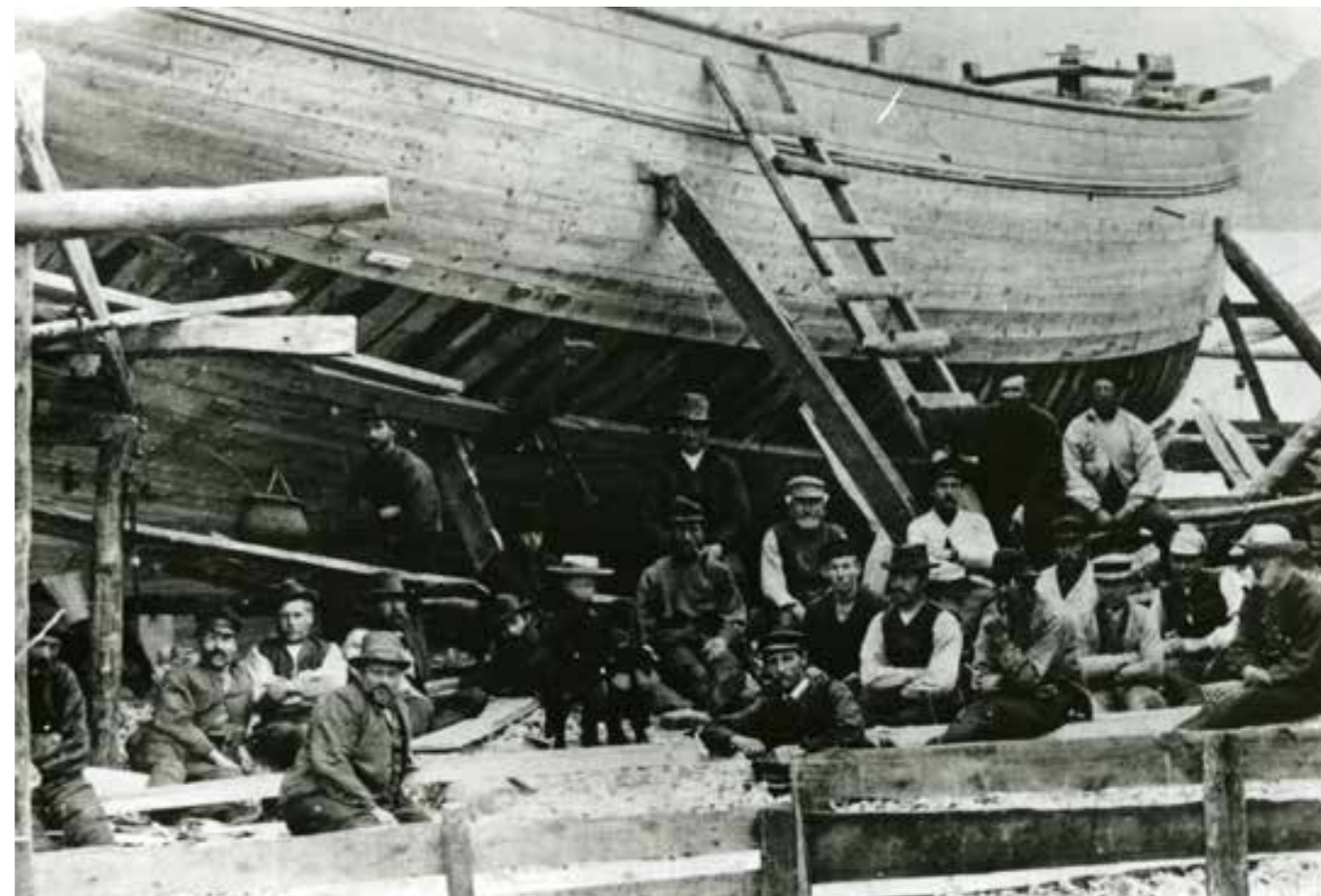
Skipsgyggjarlag ved Skaalaverftet 1894