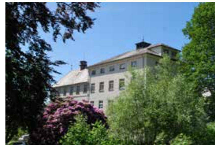
Valen sjukehus