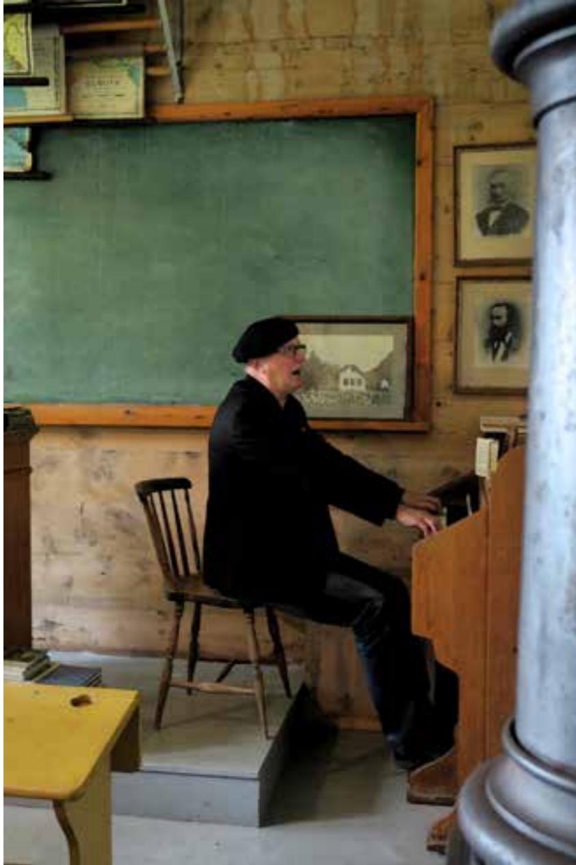
Skulemeistaren ved trøorgelet