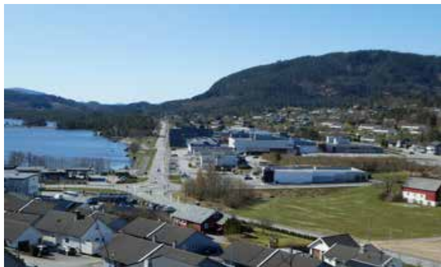
Husnes i dag

Bøkkerverkstaden er i privat eige, og Kvinnherad kommune har leigeavtale om bruken av verkstaden til formidling. Bøkkerverkstaden vart opna som museumshus i 1995. Kommunen har samarbeid med Sunnhordland museum som nyttar denne tønneverkstaden til formidling av båtbygging med meir. Prosjektet «Eg byggjer meg ein båt» har år om anna vore ein populær læringsarena med støtte frå «Den kulturelle skulesekken». Kvinnherad kommune har avtale om leige av Bøkkerverkstaden til formidling av kulturminne.