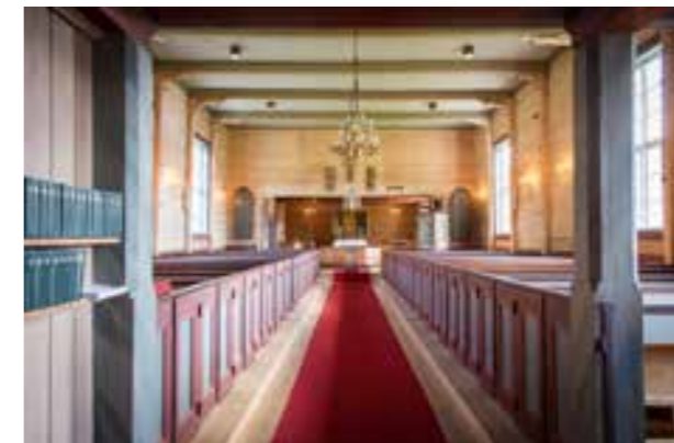
Åkra kyrkje inngang november 2015