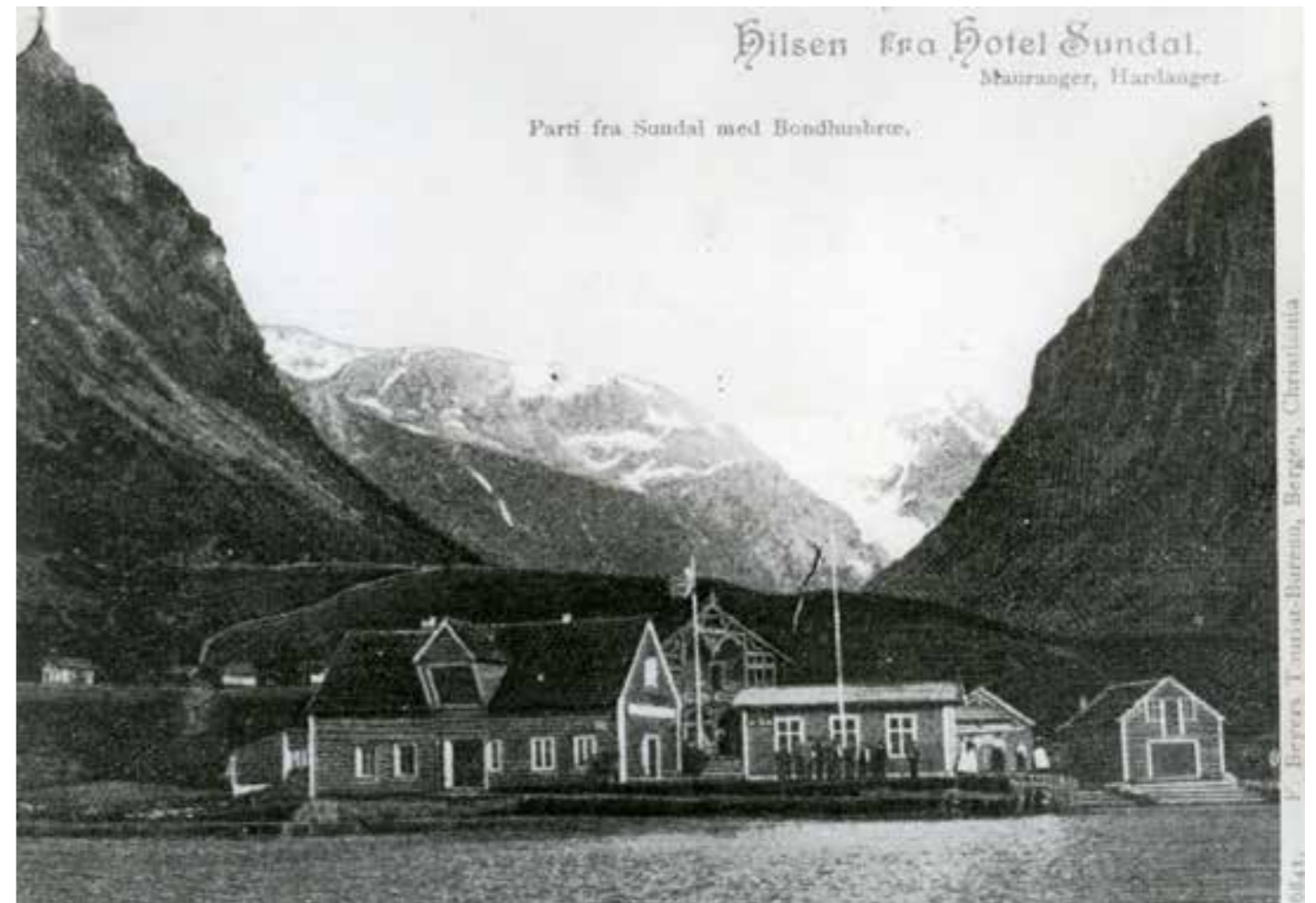
Hilsen fra Hotel Sundal

For prioriterte kulturminne kan det verta pålagt vedlikehald med heimel i plan- og bygningslova og innarbeidde føresegner i denne planen. Trong for brannsikring og eventuelle andre sikkerheitstiltak skal vurderast. Det kan påleggjast vedlikehald der det er fare for liv og helse grunna samanrasing, eller der bygg eller ander kulturminne er til sjenanse for ålmenta. Det vil ikkje vera pårekneleg å få bygget opp igjen dersom pålegg om vedlikehald vert ignorert og bygget rasar saman.