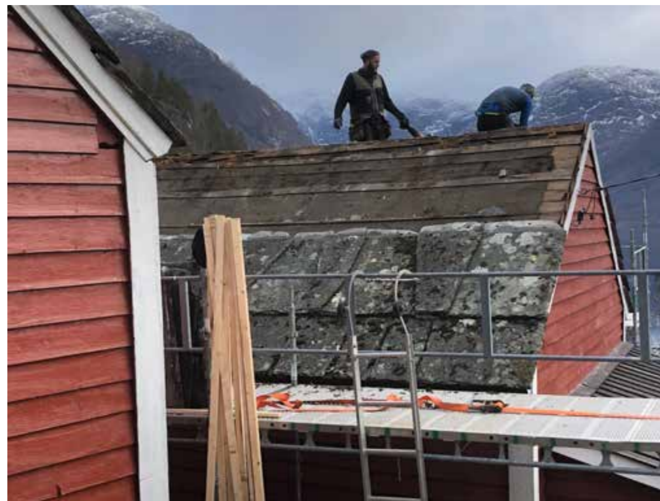
Restaurering av tak på Eikenes i Gjetingsdalen 2021.