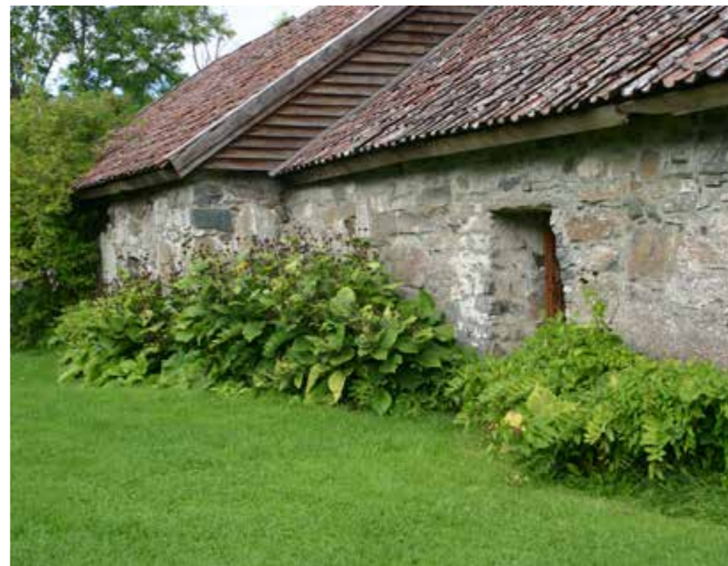
Halsnøy kloster

kyrkjene, fjordungskyrkjene, i Hordaland. På nabogarden Mel stod eit gardskapell, det vart teke stein frå dette kapellet få hovudbygningen på Baroniet vart bygd. Denne tufta er skilta i dag.