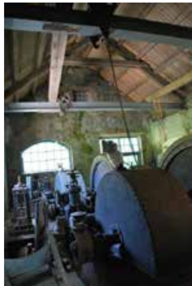
Valen gamle kraftstasjon.