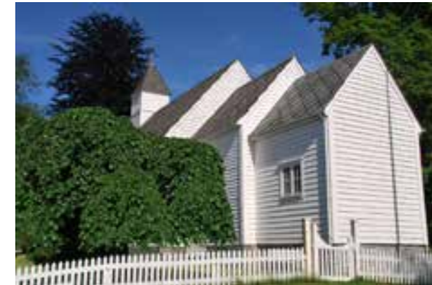
Fjelberg prestegard

får økonomiske overføringar til drift frå Kvinnherad kommune. Dette er eit forpliktande samarbeid for begge partar. Desse midlane vert brukt til vedlikehald av kyrkjene. Det er eit krevjande vedlikehald av kyrkjene i Kvinnherad. Det er mange kyrkjer, og mange av dei krev ekstra vedlikehald grunna alder og vern. Kyrkja i Kvinnherad er avhengig av kommunen sine overføringar. Slik vert også vedlikehald av freda kulturminne og kulturmiljø avhengig av desse overføringane. Er det mogleg at utfordringane med vern og skjøtsel av dei freda kulturminna kan gjerast på ein betre måte?