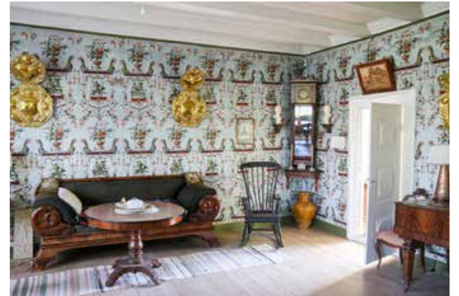
Interiør Kapteinsgarden

Bustadhusa endra seg tidleg på 1800-talet, frå opne røykstover til samanbygde stover, kammers og sengebu. Museumstuna Gjerde, Nistovo og Rød, er døme på tre stadium i denne utviklinga. Frå 1860-talet ser ein påverknad av urban byggjeskikk med symmetrisk