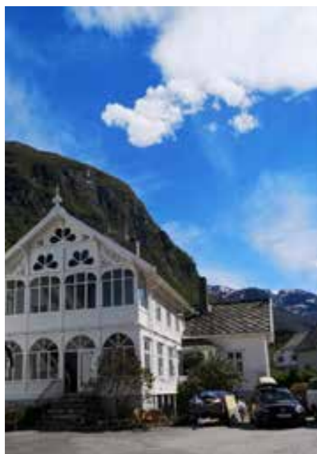
Hardanger Fjordlodge