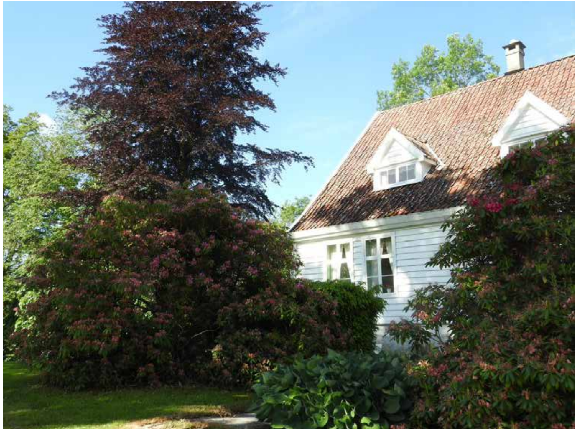
Fjelberg prestegard

Alle inngrep i vedtaksfreda kulturminne krev dispensasjon frå regionale kulturminnemynde. Det er ikkje høve til å gje dispensasjon for tiltak som fører til vesentlege inngrep i kulturminnet.