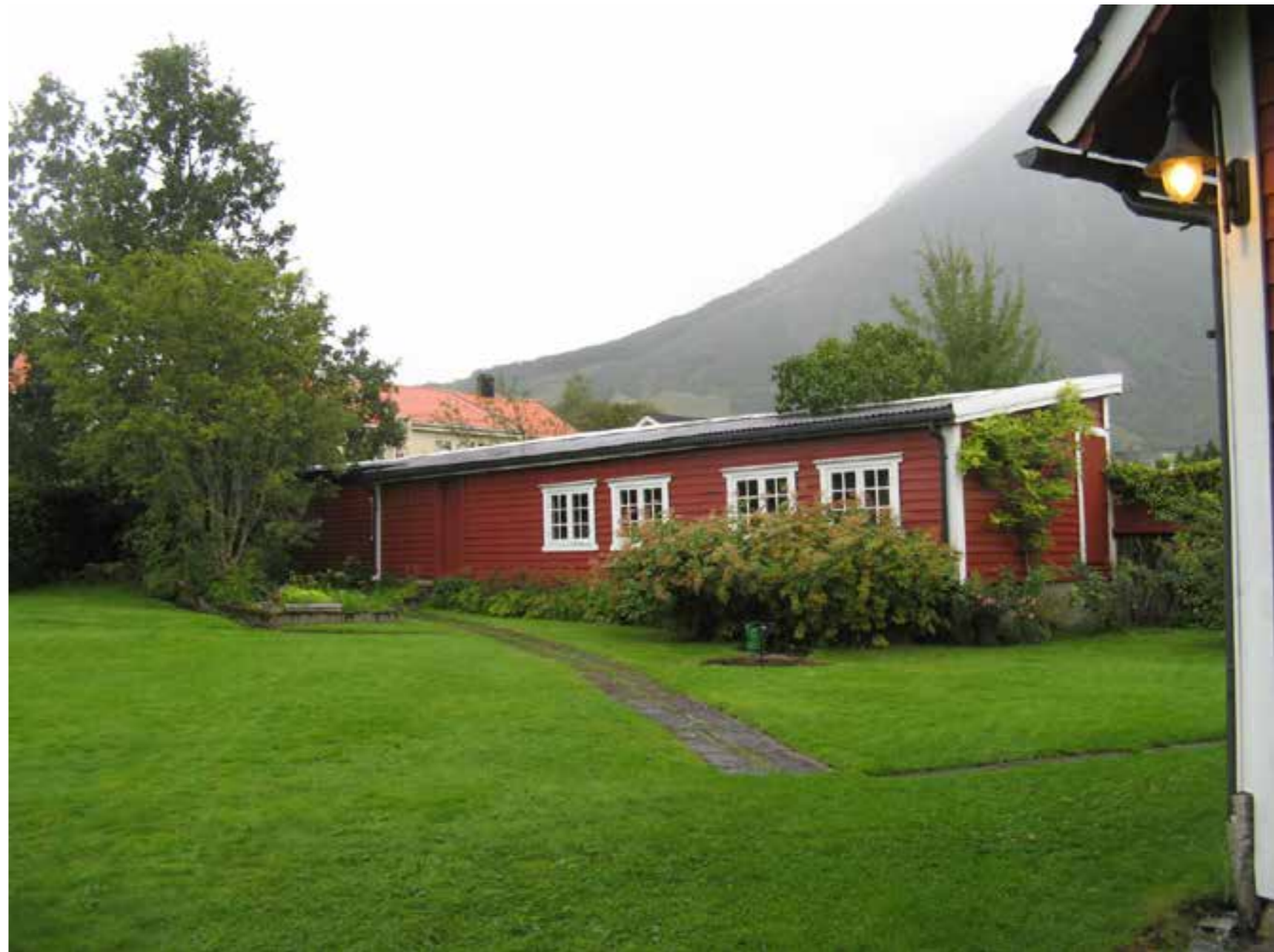
Prydfuglhus i Rosendal

Kulturminne har ikkje berre verdi som kjelde til oppleving, kunnskap og identitet, dei kan også vera ein ressurs i kommunal og regional samfunnsutvikling. Formidling av kulturarv styrkjer staden sin identitet og særpreg, og kan nyttast i omdømebygging. Verdiskaping knytt til kulturarv er eit viktig kommunalt og regionalt potensiale. Kommunen har verkemidlar til å la kulturarven vera ein ressurs i samfunnsplanlegginga, og den grunnleggjande reiskapen er det kommunale planarbeidet.