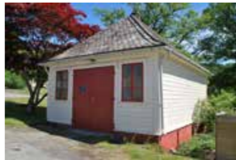
Brannstasjonen på Valen sjukehus

Alle inngrep i forskriftsfreda kulturminne krev dispensasjon frå Riksantikvaren (for byggverk og anlegg i statleg eie) eller regional kulturminnemynde (kulturmiljø). Det er ikkje høve til å gje dispensasjon for tiltak som inneber vesentlege inngrep i kulturminnet.