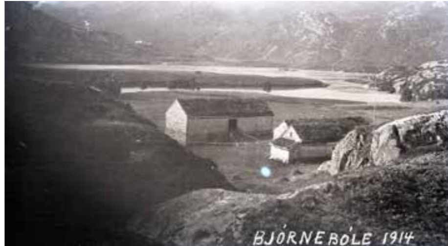
Bjørnebole 1914.

Omsynssone c er anbefalt nytta for å tydeleggjera kor kulturminne skal verta ivareteke særskilt, eller kor det skal gjelda særskilte retningsliner. Der det er formålstenleg med differensiering, kan det lagast ulike retningsliner til omsynssonene alt etter ei konkret vurdering av arealet og kulturminna som skal vernast innanfor kvar sone. Differensiering kan ta utgangspunkt i typen kulturminne, eller verneverdien til kulturminne. I fleire tilfelle vil det truleg vera føremålstenleg å samla fleire kulturminne inn i ei omsynssone som siktar til eit større kulturmiljø. Dette gjer det lettare å gje føresegner/retningsliner som tek vare på samanhengen kulturminna opptre i. Det kan ikkje gjevast føresegner til omsynssone c i kommuneplanen, med mindre det gjeld randsoner rundt nasjonalparkar og landskapsvernområde. For å sikra kulturminna i omsynssone c med konkrete føresegner, kan ein utarbeida føresegner til det arealformålet som kulturminna ligg innafor.