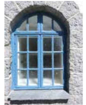
Vindauge på Valen sjukehus

Utfordringane er formidling av historia, samarbeid og utviklingsarbeid med lokale, kommunale og regionale aktørar og kulturmynde.