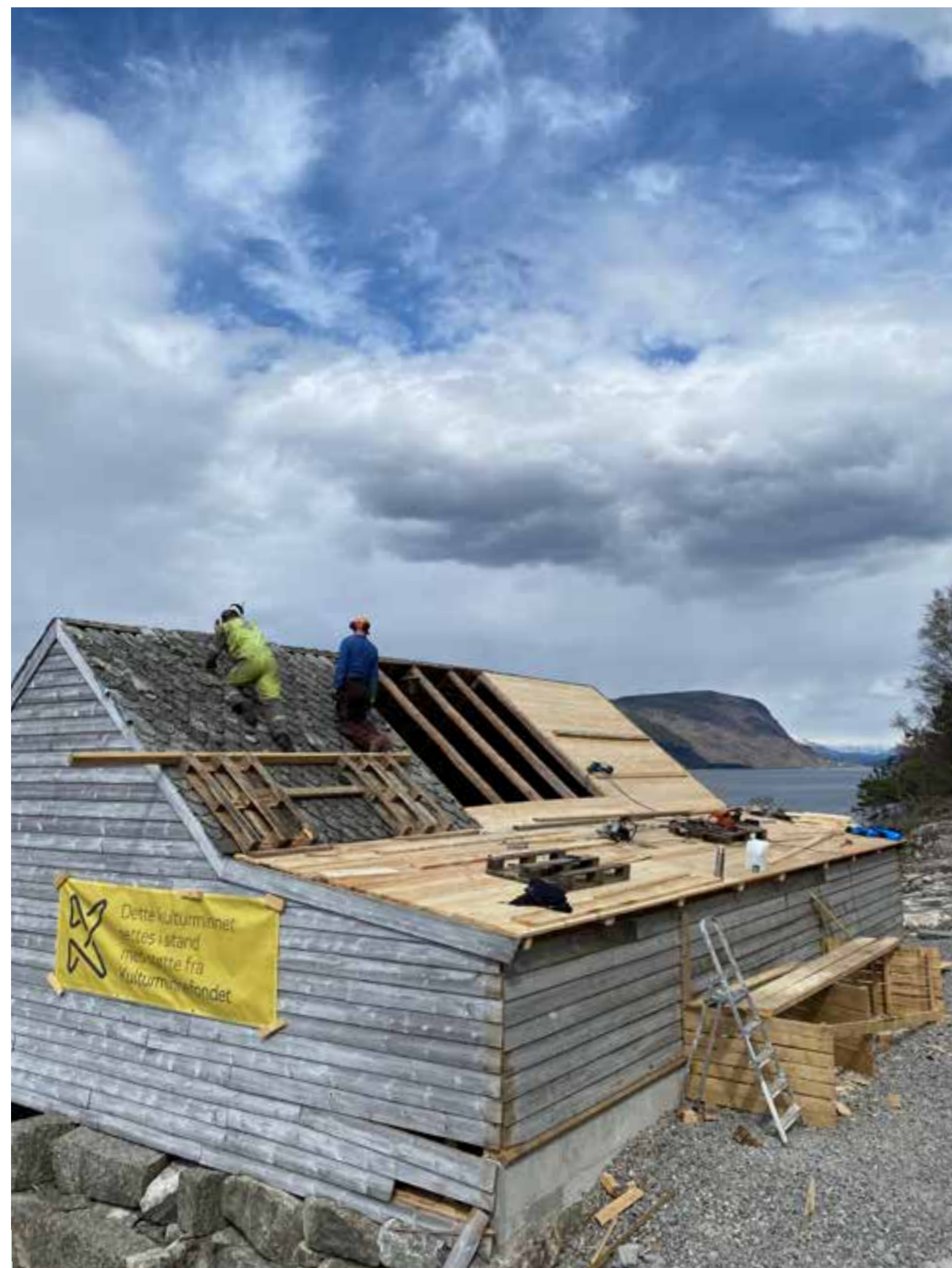
Restaurering av båtbyggerverkstaden på Ramsgrø gd.