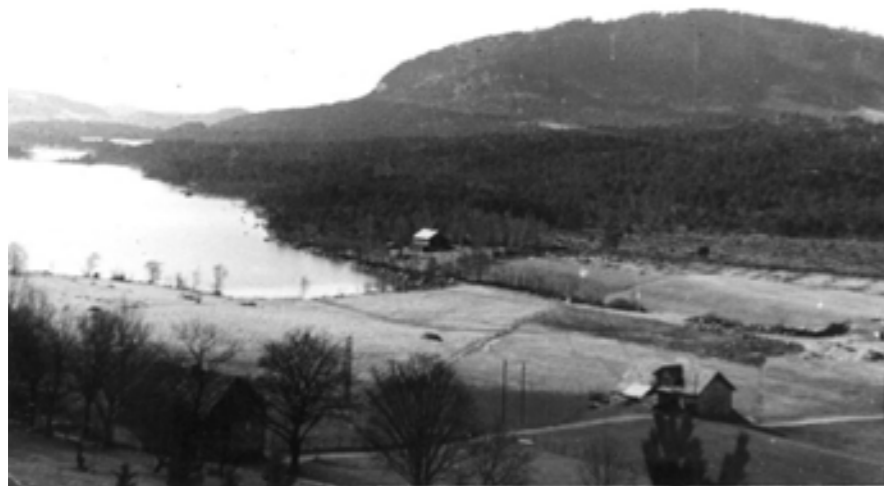
Husnes i gamle dagar