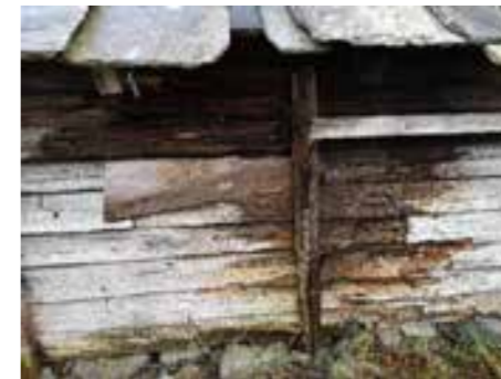
Prestanaustet før restaurering.

Prioriteringa som vert gjort på bakgrunn av verdsetjing av kulturminna vil difor vera ein viktig reiskap i kulturminnearbeidet framover. Det vil gjera situasjonen meir føreseieleg for grunneigarar og tiltakshavarar, og det vil effektivisera og letta den kommunale sakshandsaminga. Klassifiseringa vil også vera ein nyttig bakgrunn i kontakt med regionale og nasjonale styresmakter når det gjeld tiltak og støtteordningar.