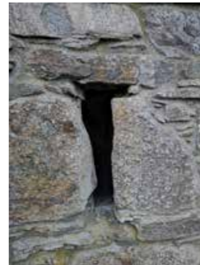
Klosteret på Halsnøy