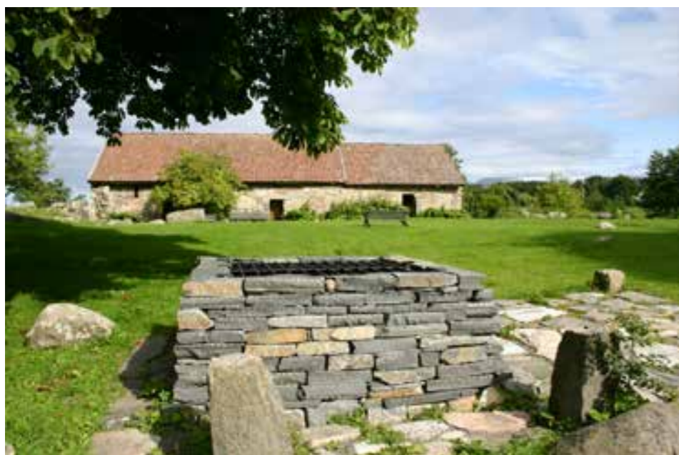
Halsnøy Kloster

Kvinnherad har kulturlandskap, kulturmiljø og kulturminne av mange slag, som kan daterast attende frå dei tidlegaste tidene og fram til i dag.