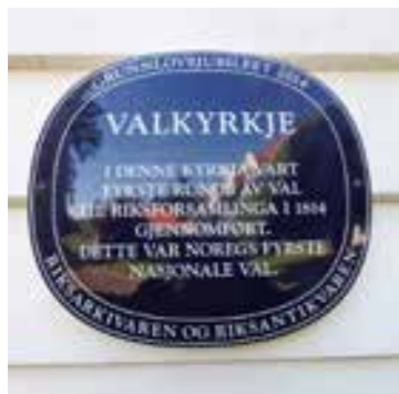
Fjelberg kyrkje

Tilrettelegging og vidare formidling av historie er eit kontinuerleg arbeid. Vidare formidling av historiene til kulturminna som er vedtaksverna er viktig, og å kunna visa fram bygningane, områda rundt og tilby tilreisande gode opplevingar. Løysingar for vern ved bruk er viktig, samstundes som ein er medviten om kulturmiljøet og kulturminna sin eigen verdi.