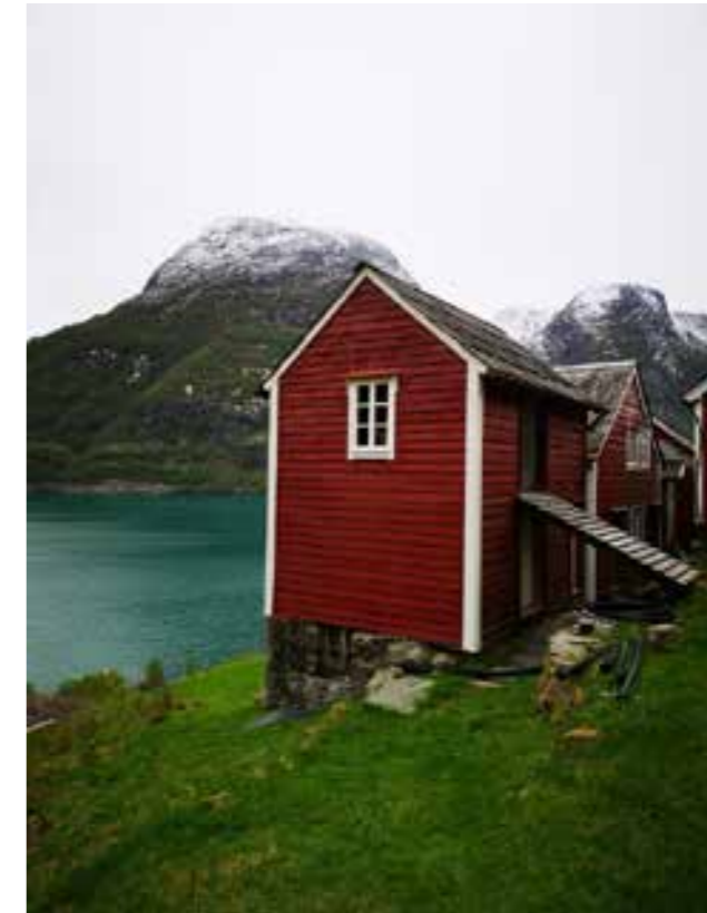
Rekkjetunet på Eikenes

Takk til alle som har bidrege til planarbeidet med innspel, merknadar og anna!